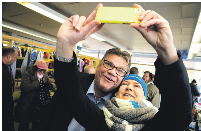
Korson maalaismarkkinoilla otettiin selfieitä.

nossa tukemassa suomalaista työtä ja yrittäjyyttä.