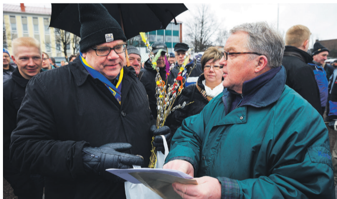
Puheenjohtajaa tentattiin Salon markkinoilla.

– Ei kuitenkaan syöttötariffeja. En ymmärrä sitä, että veronmaksajat tukevat sadoilla tuhansilla euroilla kannattamattomia elinkeinoja. Pitkäaikaistyöttömiä ei saa hylätä, vaan järjestää heille työtä. Ostovoima on pidettävä kun-