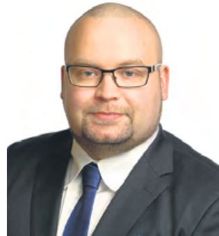
Perussuomalaisen Pirkanmaan piiri

- Kiitän nöyrimmin luottamuksesta ja tulen tekemään kaikkeni, että perussuomalaiset Pirkanmaalla tulevat menemään yhtenä rintamana kohti tulevia vaalivoittoja, tuore puheenjohtaja kiittää.