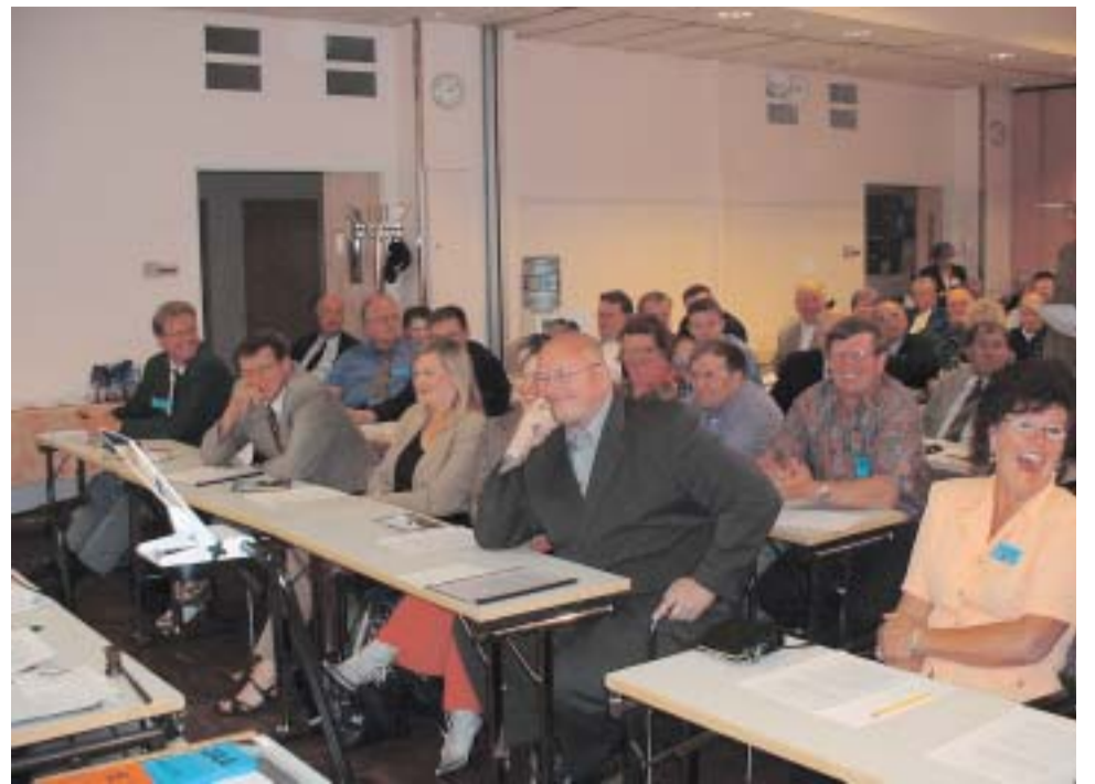
Puheenjohtaja Soini saa kokousväen naurunremakkaa

Nuoret perheet ovat rajusti velkaantuneita! Ei heidän taloutensa kestä mitään tur-