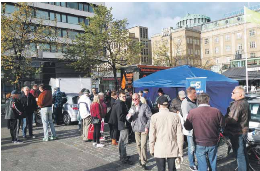
Kuva: Lauri Karppi