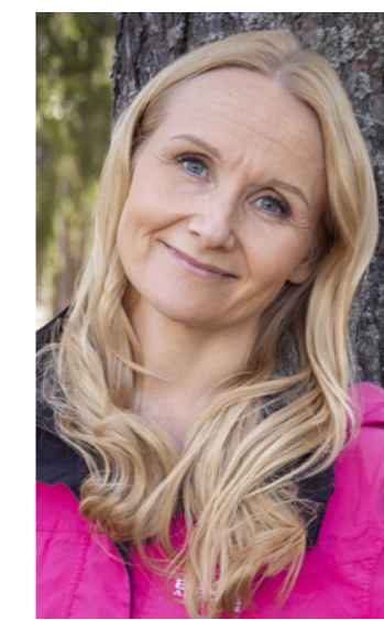
- Uudenlainen isänmaallinen ja konservatiivinen Eurooppa on tavoitteeni, Garedew kertoo.

- Koko maapallon pelastaminen ja hiilineutraalisuustavoitteet tulisi heittää romukoppaan, Garedew sanoo.