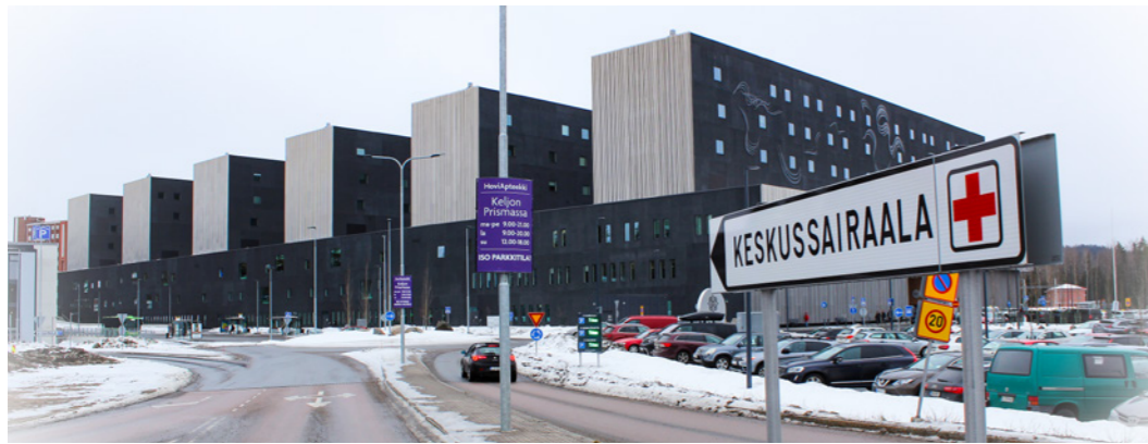
Moni pelkää, että soteuudistus vie palvelut liian kauas.

Edellisen hallituksen kallis soteuudistus nielee rahat