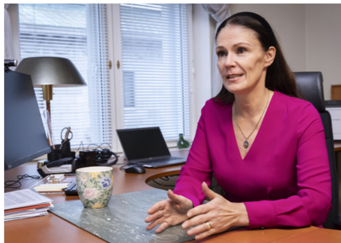
Liikenne- ja viestintäministeri Lulu Ranne kertoo hallituksen sitoutuneen tärkeisiin infrastruktuuriin.

rakentajana. Ministeriöillämme sekä virastoillamme on pitkä perinne erinomaisesta yhteistyöstä yli hallinnonalojen erityisesti puolustusministeriön ja Puolus-