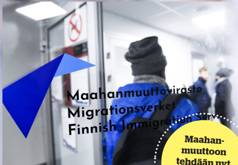
Maahanmuuttoviraston ovi kävi turhan tiuhaan edellisen hallituksen aikana.

Maahanmuuttoon tehdään nyt merkittäviä kiristyksiä.