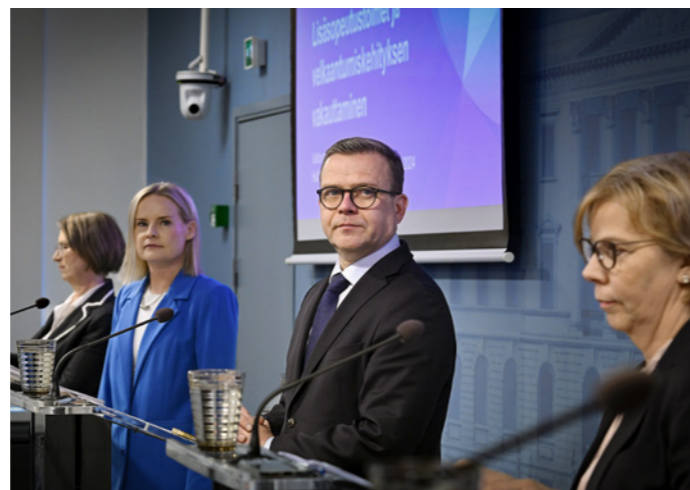
Hallituksella on täysi työ laittaa valtiontalous kuntoon ja luoda edellytyksiä työllisyydelle ja talouskasvulle.

pistetaan 1,6 miljardia euroa vuonna 2028. Veronkorotuksien staattinen bruttovaikutus on 1,8 miljardia euroa vuonna 2028.