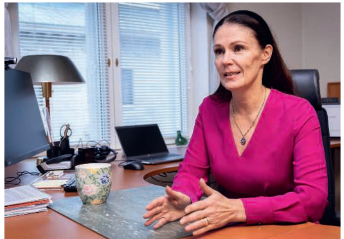
Liikenne- ja viestintäministeri Lulu Ranne kertoo hallituksen sitoutuneen tärkeisiin infrastruktuuriin.

rakentajana. Ministeriöillämme sekä virastoillamme on pitkä perinne erinomaisesta yhteistyöstä yli hallinnonalojen erityisesti puolustusministeriön ja Puolus-