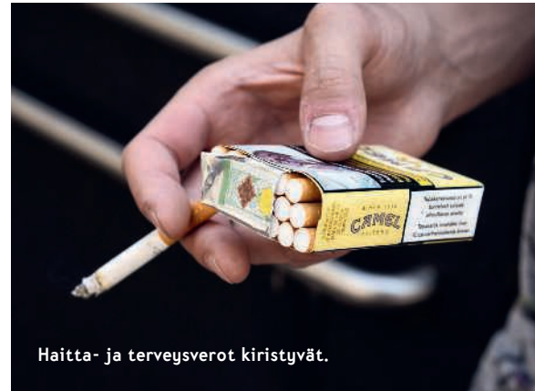
Haitta- ja terveysverot kiristyvät.

noinin kohdistetaan 150 miljoonan euron vuotuinen säästö aiempien päätösten lisäksi. Hallinnon keventämistä valmistellaan ministeriöissä.