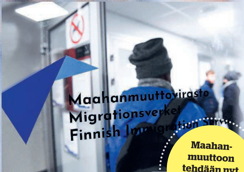
Maahanmuuttoviraston ovi kävi turhan tiuhaan edellisen hallituksen aikana.

Maahanmuuttoon tehdään nyt merkittäviä kiristyksiä.