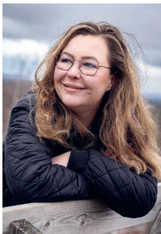
Suurpetopoliitikka on yksi asia, joka pitäisi Antikaisen mukaan muuttaa.

litiikka on sellaista, jossa parlamentaarikkojen täytyy pitää Suomen puolta. Se on nyt paremmilla kantimilla, kiitos tämän hallituksen. Hallitus vastusti ennallistamisasetusta, joka olisi ollut Suomelle epäedullinen, Antikainen toteaa.