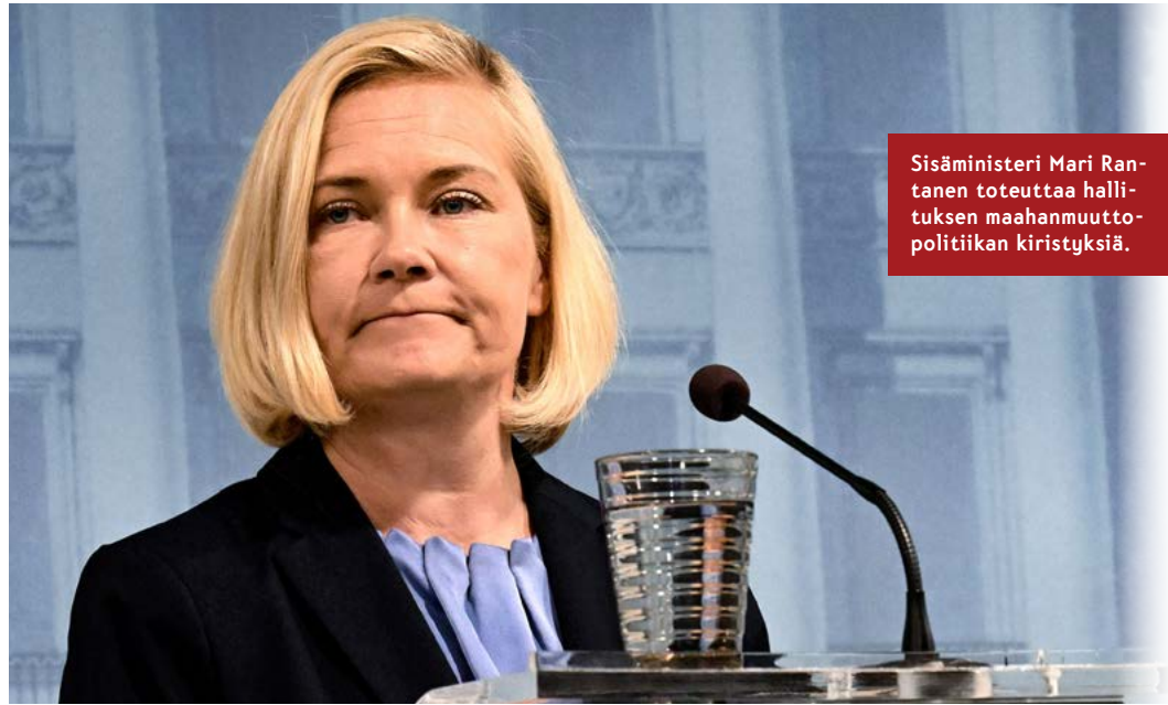
Sisäministeri Mari Rantanen toteuttaa hallituksen maahanmuuttopolitiikan kiristystä.