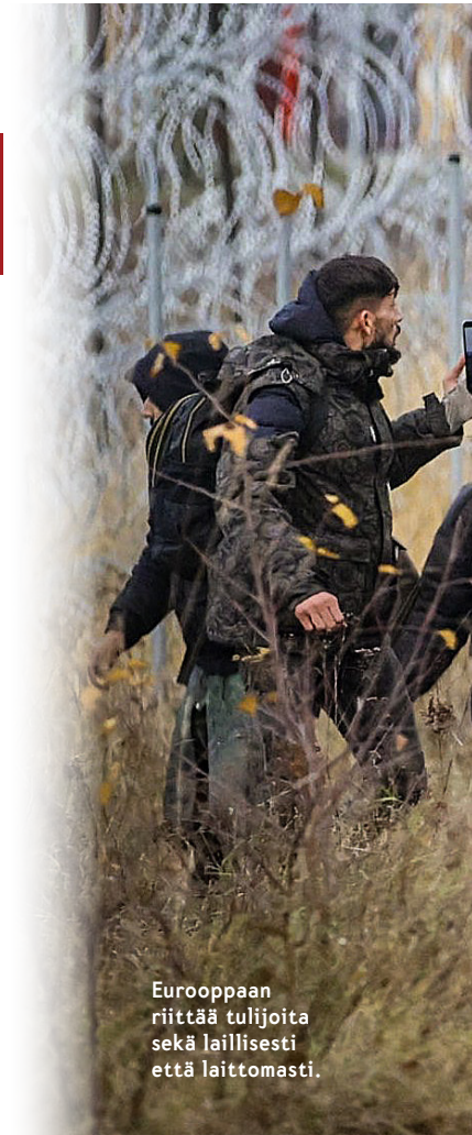
Eurooppaan riittää tulijoita sekä laillisesti että laittomasti.

Perussuomalaiset vaatii tiukennuksia maahantuloon ja maahanmuuttoon